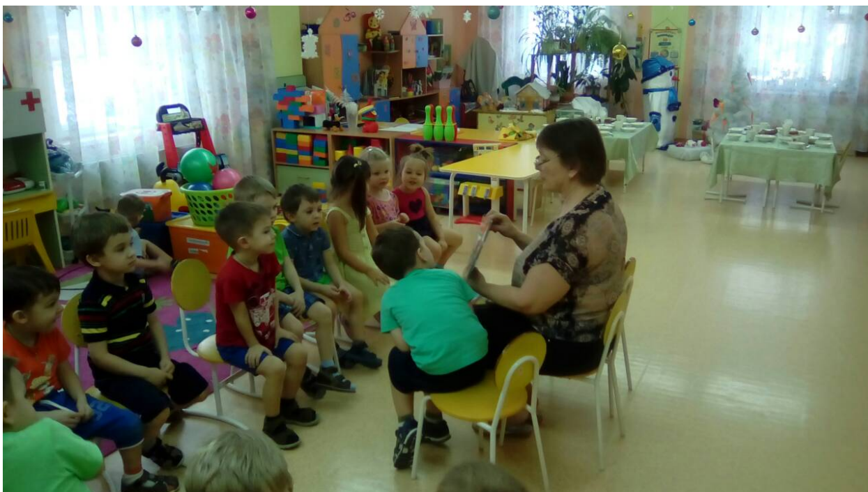
Знакомство с творчеством Г. Остера. Чтение отрывка из произведения «Котёнок по имени Гав».