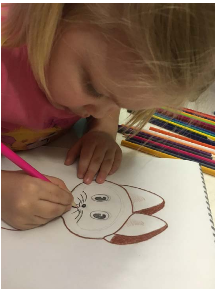
Домашние зарисовки по прочитанному произведению.