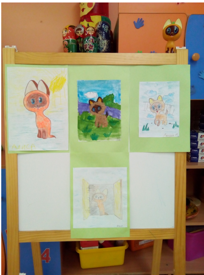
Выставка рисунков из «домашних зарисовок».